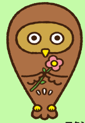
フクシロウ 東京都福祉人材センター イメージキャラクター