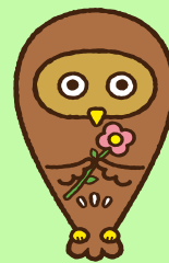
フクシロウ 東京都福祉人材センター イメージキャラクター