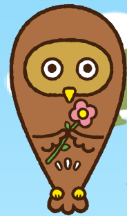
フクシロウ 東京都福祉人材センター イメージキャラクター