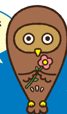
東京都福祉人材センターキャラクター フクシロウ