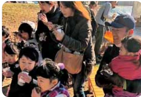
◆ 住民主体の居場所づくり・つながりづくり ◆