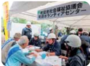
◆ 災害に備えた取り組み ◆