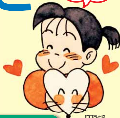
町田市社協 イメージキャラクター あいちゃん