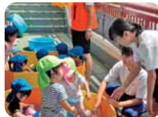
◆ ボランティア活動 ◆