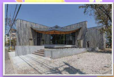
そだちのシェアステーション