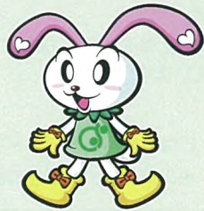
調布市こころの健康支援センター