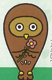
東京都福祉人材センター キャラクター フクシロウ

※雇用保険受給中の方は「雇用保険受給資格者証」をお持ちください。 求人概要は、東京都福祉人材センターのホームページで約1週間前から公開いたします。 https://www.tcsw.tvac.or.jp/jinzai/