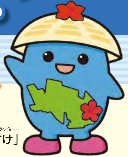
国分寺市協 マスコットキャラクター 「ふくすけ」

国分寺市内の福祉施設・事業所で働ける求人があります！ フルタイム、パートタイムなど雇用スタイルも様々。 あなたに合った福祉のしごとが見つかります！