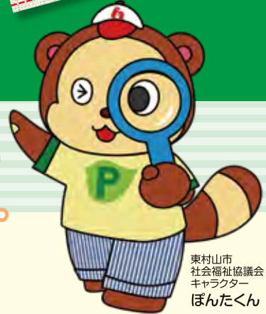
東村山市 社会福祉協議会 キャラクター ぼんたくん

東村山市内の福祉施設・事業所(高齢・障がいなど)で働ける求人が あります!!フルタイム、パートタイムなど雇用スタイルも様々です。 「まずは仕事の内容を知りたい」という方もOKです。