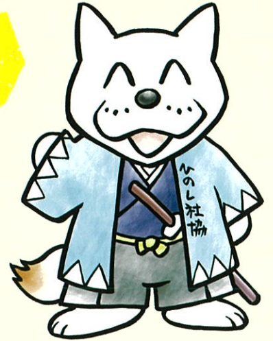
日野市社協キャラクター ひの助