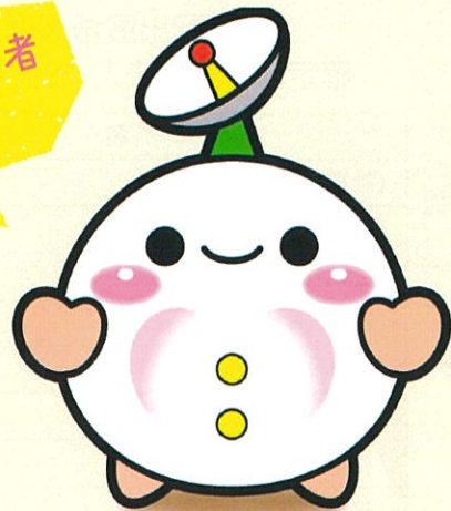
多摩ボランティア・市民活動支援センター タマボラ君