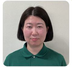
社会福祉法人あいのわ福祉会 竹の塚あかしあの杜