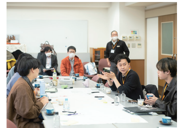
日野でのふりかえり