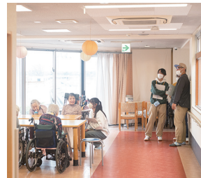
東久留米での一コマ

幹事委員が所属する施設を中心に、昨年12月には東久留米市の高齢者施設「シャローム東久留米（特別養護老人ホーム）／シャローム南沢（デイサービスセンター）」、1月には日野市の地域ネットワークとして障害者施設3施設（「工房夢ふうせん／工房夢ふうせんアネックス」（知的）、「多摩療護園」（身体）、「光の家栄光園／光の家新生園」（身体））