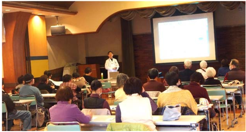
↑公開講座（月1回） ↓がんカフェ（二ヶ月に1回）