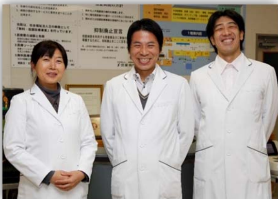
お気軽にご相談ください（医療ソーシャルワーカー）