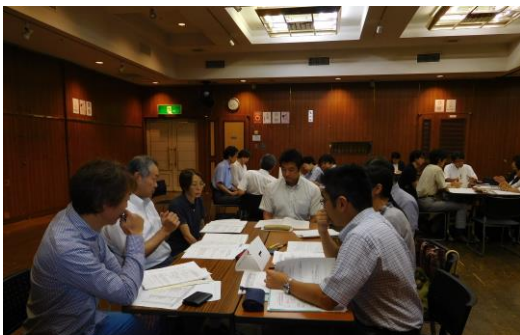
お互いの状況を情報交換しました（市部より）

8月22日（市部）と12月6日（区部）、東京都との共催により、標記懇談会を開催しました。