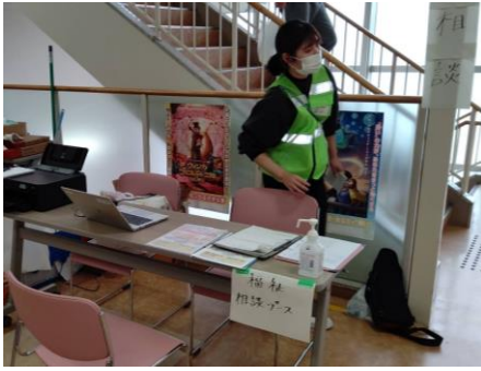
相談ブース対応(ふれあい健康センター)