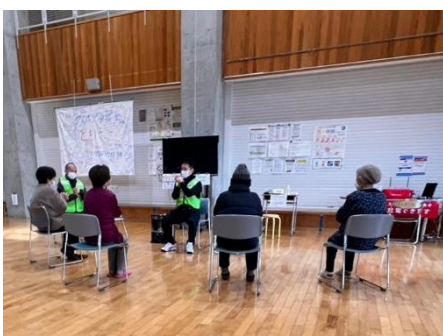
健康体操(門前中学校)