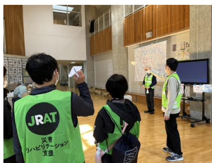
紙飛行機大会(門前中学校)