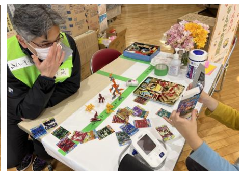
相談ブース対応(門前中学校)