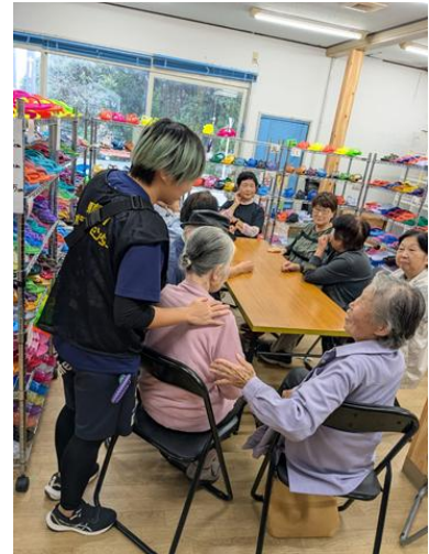
【写真:サロンの様子】