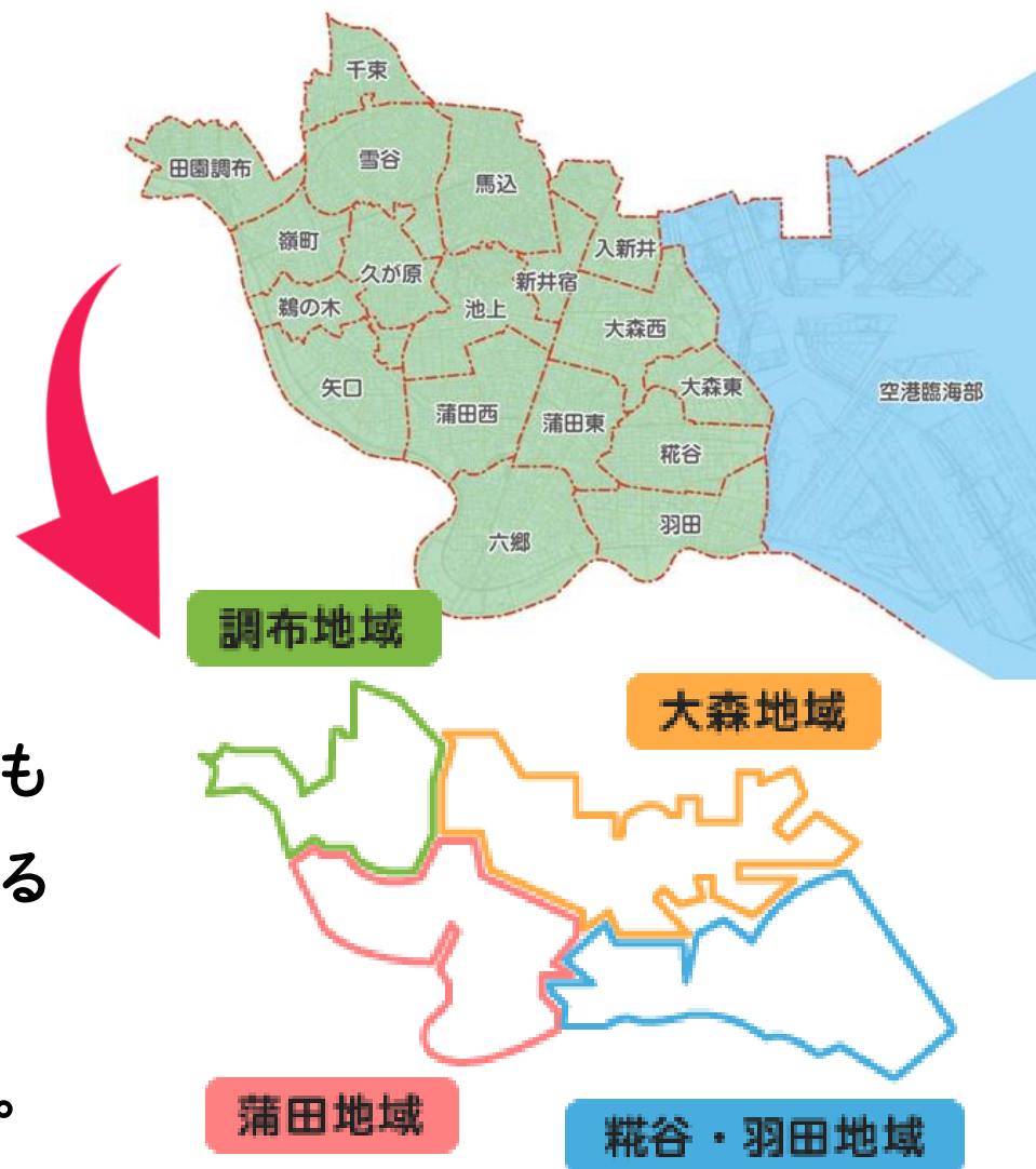
特別出張所エリア図（概ねのエリアを示したものです）