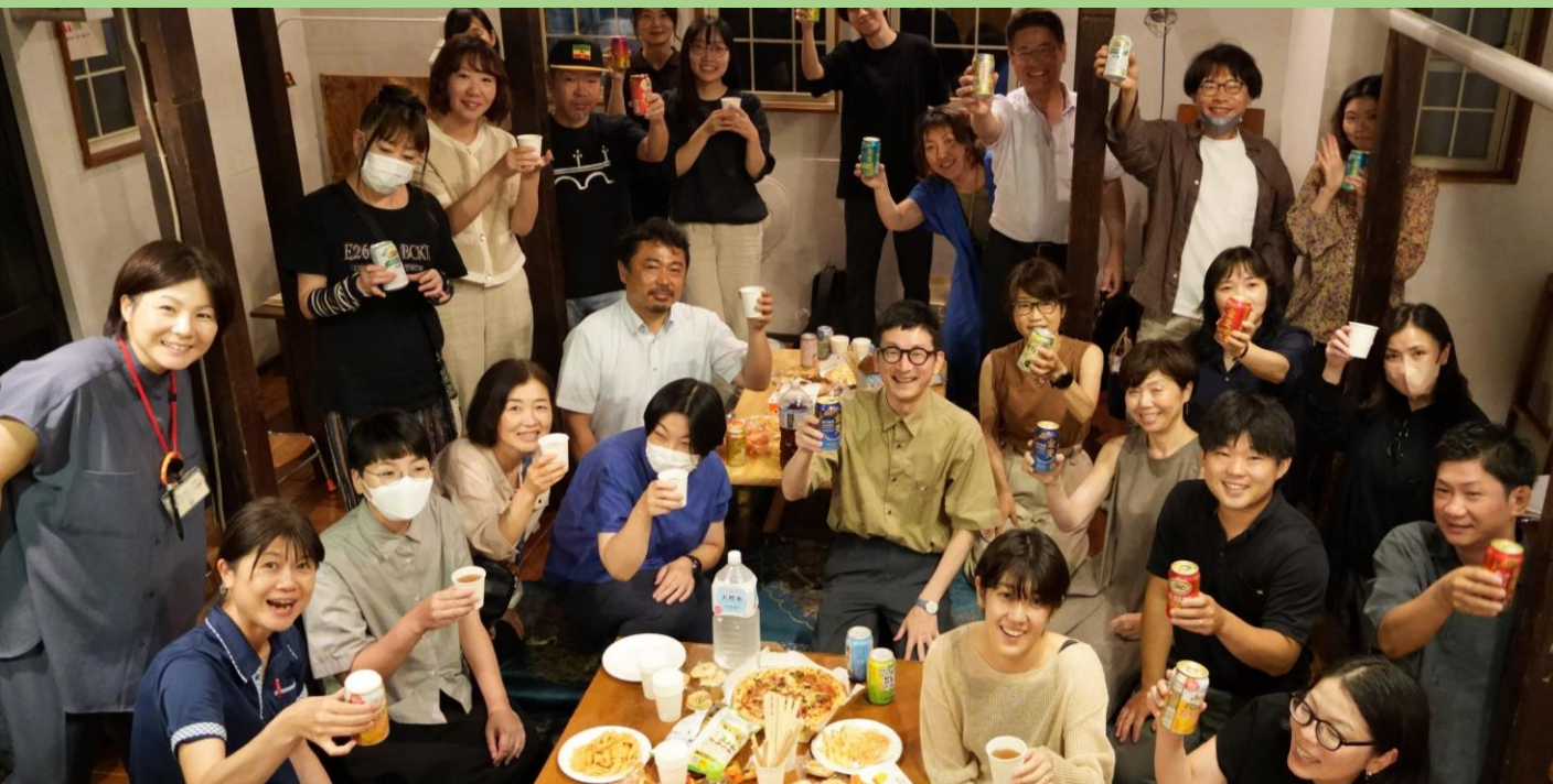
芸術×福祉の新たな参加の場づくり