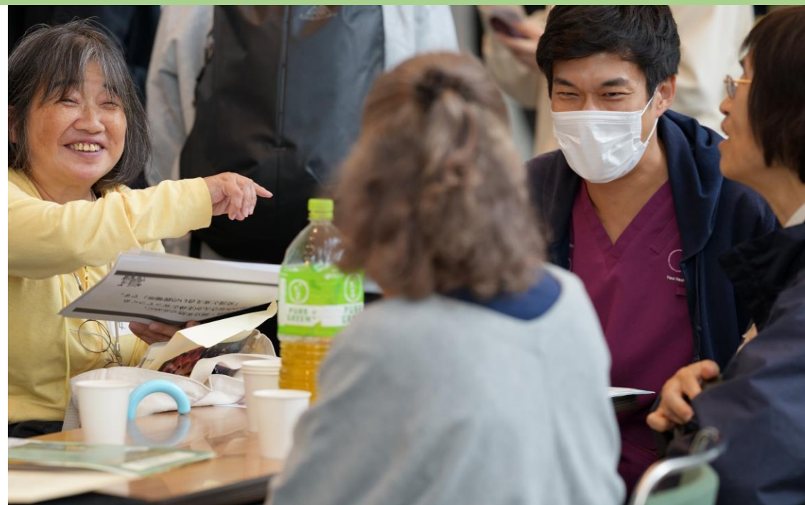
専門職・特技×地域のサロン