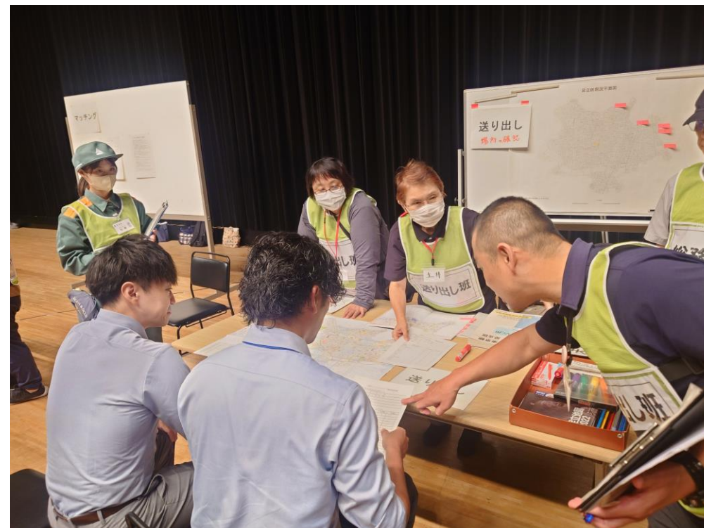
災害ボランティア登録・研修・ネットワーク