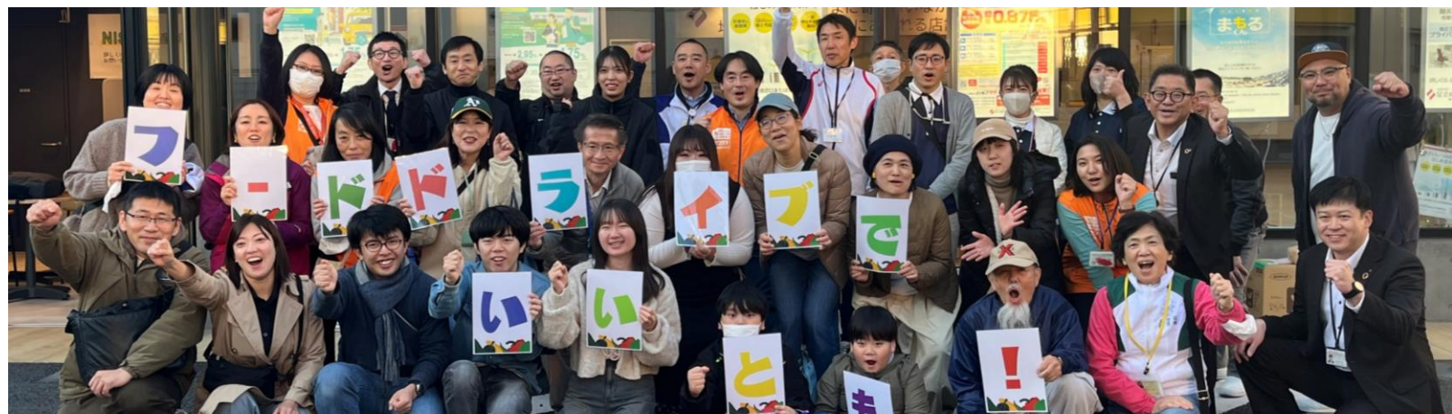
フードドライブを通じたネットワークづくり