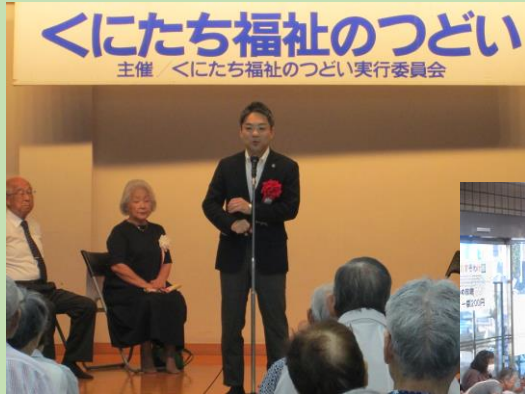
実行委員会形式実施される くにたち福祉のつどい