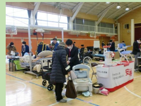
近隣の福祉用具事業者と協力して開催 「くにたち福祉機器展」