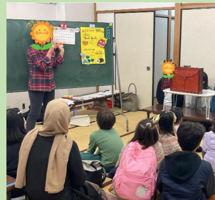
社協とボランティアが連携して外国 ルーツの小中学生の学習を支援する 「日本語学習支援教室ひまわり」