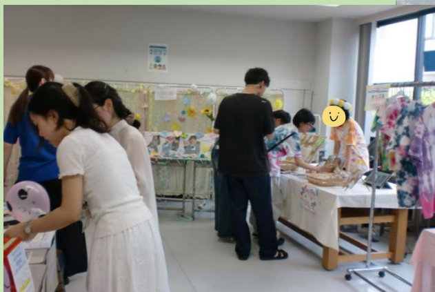
ご近所の福祉専門学校の学園祭に協力・出店 未来のくにたち社協職員がこの中に？