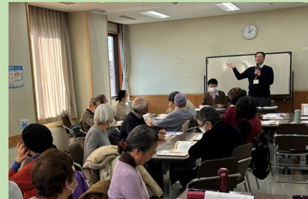
権利擁護センター エンディングノート勉強会