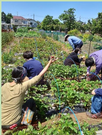
農園と居場所の新しいかたち 「くにたち陽向菜園（ひなたさいえん）」