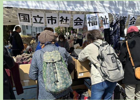
バザー部会や民生委員皆さんが中心 になって地域で開催される祭に参加