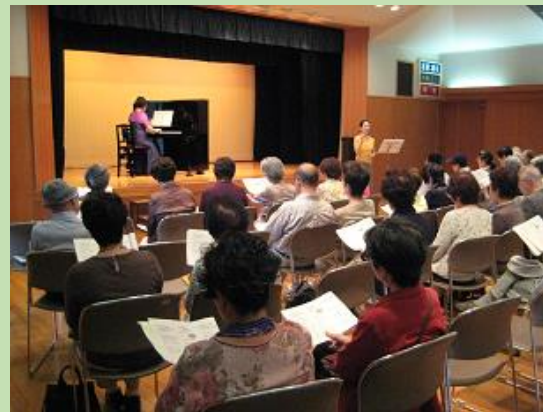
高齢の皆さんにお楽しみいただい ている“なつメロサロン”