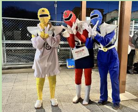
共同募金地区協力会として協力。 ご当地キャラクターも登場