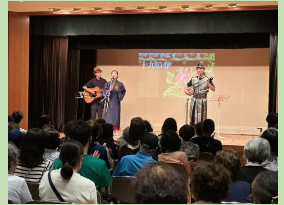
退任民生委員の皆様が中心に実施 している“チャリティー公演”