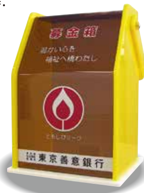
金融機関等に設置の募金箱