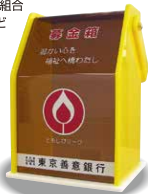
銀行等に設置の募金箱