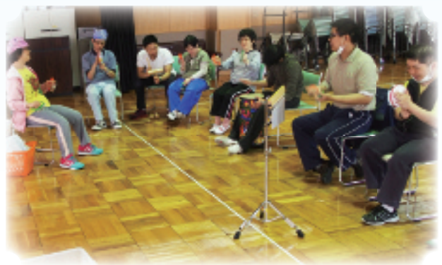
谷在家福祉作業所 生活介護（音楽クラブ）