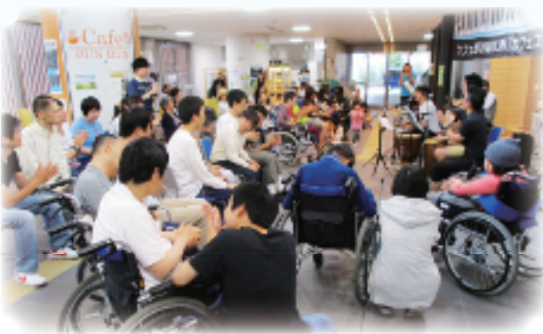
リアン文京 Cafeコンサート