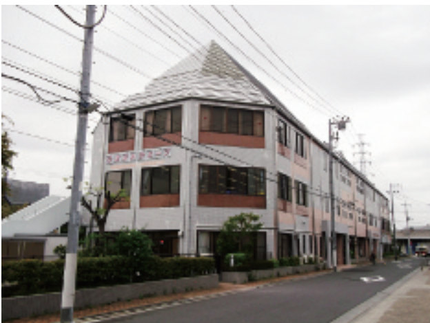
施設の外観（地域の皆様から「とんがりぼうし」と親しまれています）

福祉施設や公共施設3カ所の清掃委託を受け、日々清掃業務に励んでいます。但し、毎日何気なく清掃している訳ではなく、自立講座（勉強会）で実技試験を行ってそれぞれの苦手な所を確認したり、得意分野を伸ばしたりしています。また、外部研修にも毎年参加し、『働く』ということ、『就職するためには』という観点から、直に外の空気に触れていただく機会も設け、刺激を受けながら日々の仕事に励んでいます。