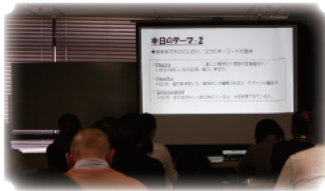
平成29年度第2回利用者支援研究会合同学習会