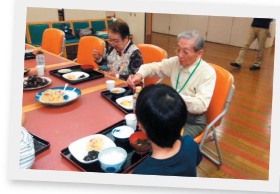
施設での子ども食堂の様子

その後特養に入所しましたが、私が頻繁に通えましたし、ときどき自宅にも帰って来たので、妻は自宅にいるような安心感があるようでした。スタッフの方も親身に相談に乗ってくれて、言いにくいこともしっかり説明してくれました。話すことが難しくなり寂しくもありましたが、こちらからの問いかけに対してはうなづいてくれましたし、亡くなる前までイベントでは一緒に体を動かすなど、楽しんでいる様子でした。医師も看護師もいらしたので、異常があればすぐに助けてもらえる安心感もありました。次第に食事量も減り、残りの時間も少ないと感じたころ、医師から「寿命で亡くなるのは大木が自然に倒れるのと同じです」という話を聞いて、延命治療は行わず自然死を選択しました。最期は老衰で眠るように亡くなりましたが、施設での生活は満足そうでした。