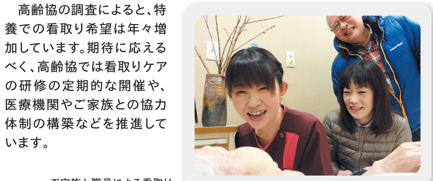
ご家族と職員による看取り

取り組み③ 質の高い認知症ケアの実施 増加する認知症の方に対し、その方の尊厳に配慮した最新の研究に基づく認知症ケアを実施しています。また、地域での認知症サポーター養成講座の開催や関係機関との連携などを通じて、地域全体で認知症の方を支えるネットワークを構築しています。