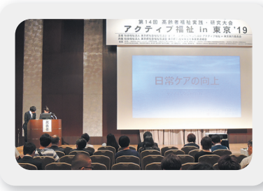
アクティブ福祉in東京

また、年一回、福祉介護の実践・研究発表大会「アクティブ福祉in東京」を開催し、各施設の先進的な介護技術などの取り組みを共有しています。