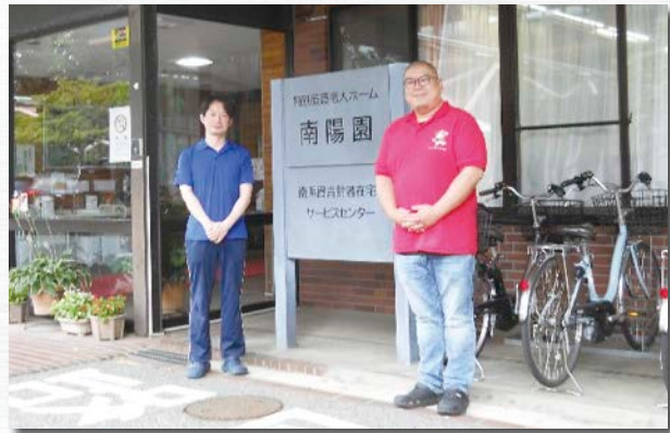
「うわさの施設」 社会福祉法人浴風会 南陽園

うわさの施設 「東京の介護ってすばらしいグランプリ2022」 「アクティブ福祉in東京'22」 受賞施設に訪問！