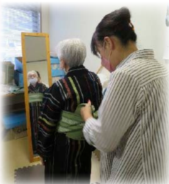
浴衣の着付けボランティア 思い出写真館行事 浴衣を着せてもらいました。