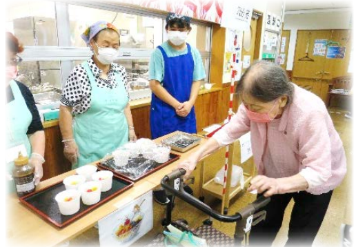
行事お手伝いボランティア おやつの販売をお手伝いしてもらいました。

「施設にとってのボランティアとは?」「ボランティアにとっての私たち施設の存在とは?」共になくってはならない存在であることを確認し続けた3年間でした。