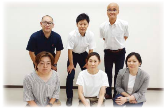
委員集合写真 (当日、ご欠席の委員もいらっしゃいました)