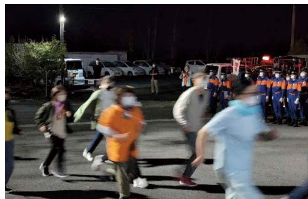
災害の激甚化、広域化に伴い、避難生活の長期化も近年の災害の特徴～3法人合同防災訓練（岐阜県中津川市にて）の様子～

新たに施行された制度のため、未知数の部分は多くありますが、それぞれの社会福祉法人がこれまで培ってきた強みや専門性を活かしつつ、地域の変化に対応し、地域における福祉サービス供給の中核的な担い手として持続可能な経営を確保するとともに、各法人が自主的に経営基盤を強化し、様々な事業展開の手段を検討できればと思っています。