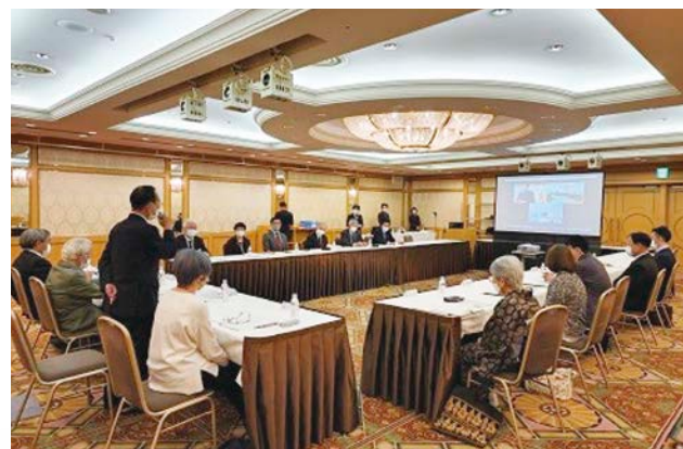
同じ目的意識を持つ法人が個々の自主性を保ちつつ連携しスケールメリットを活かせます～法人設立総会の様子～