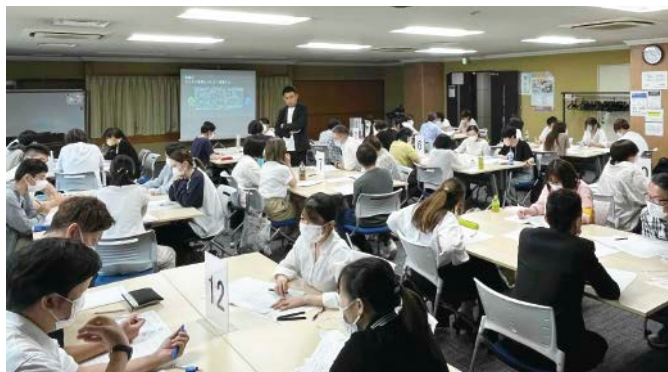
第2回研修「認知症ケアについて①」 (7月4日開催)の一場面

今年度から東京ケアリーダーズ主催の研修会を開催しておりますが、毎回たくさんの方に参加していただき大変好評をいただいています。研修で学んだ知識を施設にて実践できる、現場の介護職員にとって学びの多い研修内容となっています。研修会は今年度開催していきますので、皆様の参加をお待ちしております。