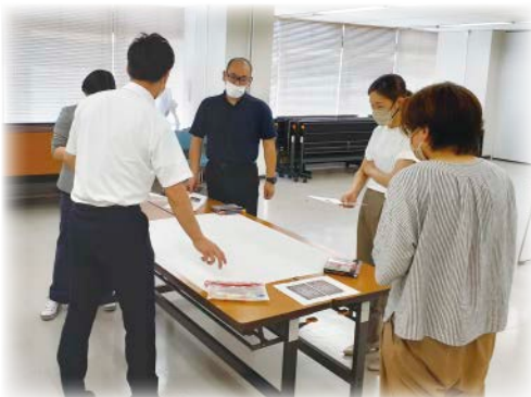
ある日の委員会の作業の様子

研修の企画、立案、運営にご興味があるケアマネジャーの参加をメンバー一同大歓迎でお待ちしています！