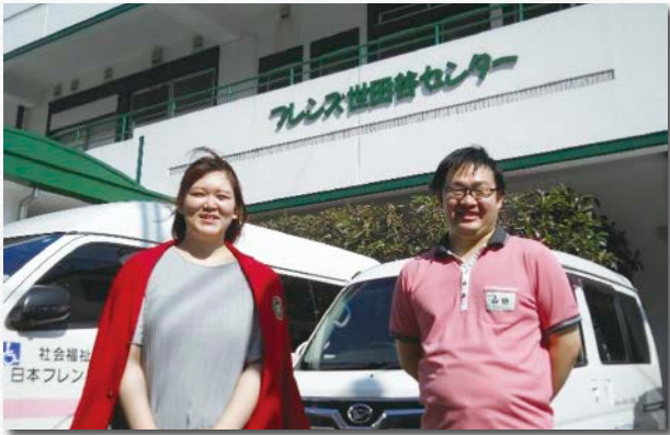
「うわさの施設」 社会福祉法人日本フレンズ奉仕団 フレンドホーム