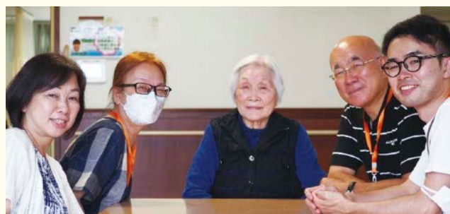
撮影時のみマスクを外しています

感染リスクもありますが、それを減らしながら コロナ禍前の当たり前を取り戻していく ことが当施設では重要だと考えています。