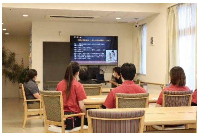
法人をまたいだ集合研修の様子

「幸せと心豊かさを未来へ」をスローガンに、よりよい地域福祉活動、福祉人材、そして社会福祉事業を未来へ繋げていくことを目的として青海波グループは出発しました。その理念を伝統的な吉祥文様である「青海波」の意味に重ねたのが、名前の由来です。現在、社会福祉法人や民間企業の5法人が参加に向けて協議をしています。経営支援事業、法人をまたぐ人事異動や交換研修等の人材確保等事業、そして災害時の相互応援を柱とする災害時支援事業は事業エリアが重ならない法人間で、一方で地域福祉支援事業や物資等供給事業は事業エリアが近い法人間で連携するイメージをしています。今後の法人経営には、課題に応じて複数の連携推進法人に加入したり、実施する事業を使い分けたりする柔軟な発想も求められるでしょう。その際に、安心して選ばれるグループにすべく、実績を重ねていきたいと考えています。