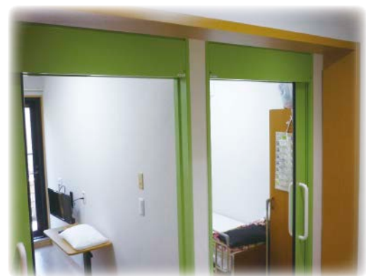
間仕切り改修後の個室