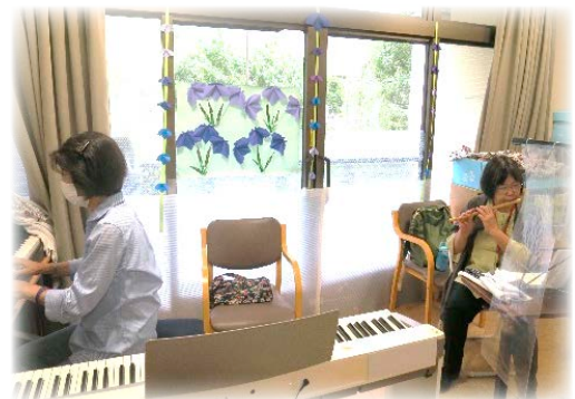
音楽活動ボランティア 演奏時は、飛沫予防のパーティションを使用しました。