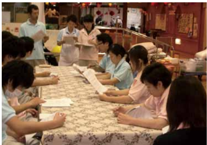
●機能訓練の研修の様子

機能訓練指導員の場合、多くの施設では常勤配置が1人といういわゆる「1人職種」です。よく1人職場という人がいます。しかし、機能訓練の専門性を発揮しつつ、他職種と関わりをもち、チームの一翼を担うわけですから1人職場ではないことがお判りいただけると思います。1人でも多くの機能訓練指導員に活躍していただきたいと願っています。