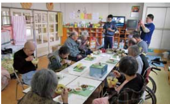
食事の様子(落合保育所)

避難所の方の緊急受診の際は、介助のために同行しました。港周辺の病院は津波や火災の被害に遭い、難を逃れた気仙沼市民病院、特に内科は数百人の患者で溢れていました。知り合いに会うと「生きていたんだ」「無事で良かった」「命だけでも助かって良かった」「がんばって生きて行こう」と被災者の患者同士で励ます姿が印象的で、涙でいっぱいになり、心が痛みました。合間をみてお話を伺うと、ほとんどの方が避難所からの患者でした。「ボランティアの方々、全国からの心ある救援物資で助かりました」「自衛隊