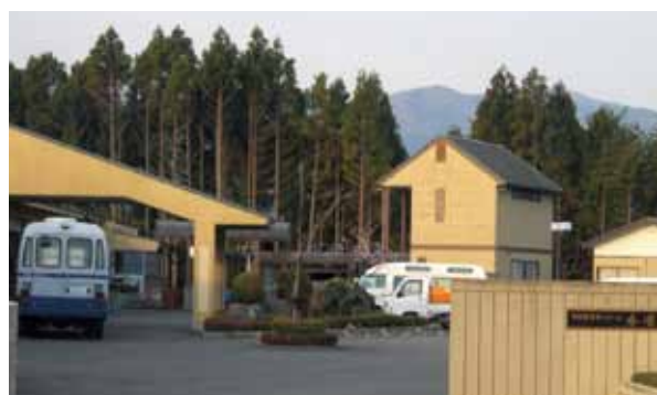
春圃苑外観。5月末現在も下水道が復旧しておらず、厳しい生活状況が続いている

私が入選に際して考慮したことは、想像を絶する被災地の様子がリアルタイムで報じられる中、介護の技術は当然にしても、どのような状況にも何とか対処できる体力とコミュニケーションの力を備えていることであった。当施設の現状から複数の職員が抜けるのは厳しいが、連れがあれば心強いらしく考えた。候補の2名はどちらも女性である。彼らは第1陣で被災地に赴き、4月10日から15日の期間で、中4日、主として介護業務に従事した。