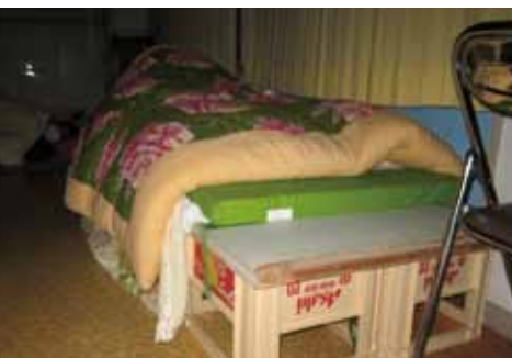
ビール瓶の空きケースを重ねてベッドにしている様子(落合保育所)

震災前は自立され一人暮らしをされていた方がほとんどですが、みなさんが地震の話をされ、本当の笑顔がなく寂しい様子が伺えました。震災後、ゴミの中から発見された方、津波のため高台に避難したが自衛隊に救助されるまで3日間飲食できなかった方など、九死に一生を得た方が大半でした。