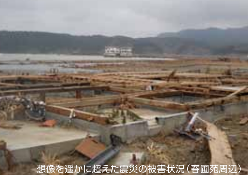
想像を遥かに超えた震災の被害状況(春園苑周辺)

清拭、シーツ交換)が5割で、残りの5割は臨機応変に清掃や話し相手などを、という指示を受け、重度者が40名ほど(半数は経