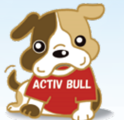
マスコットキャラクター 「アクティブル」