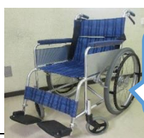
中野区立 弥生福祉 作業所