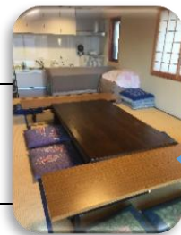
グループ ホーム夢