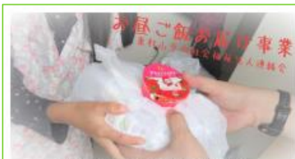
東村山市内社会福祉法人連絡会