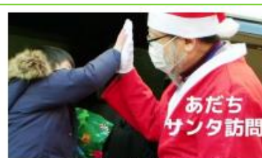
足立区社会福祉法人連絡会