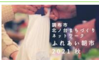
調布市北ノ台まちづくりネットワーク