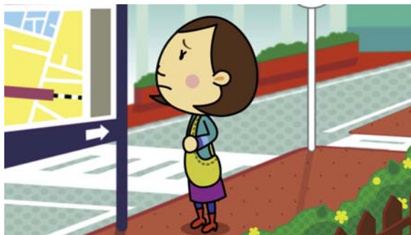
障害のある人が地図がわからなくて困っている。