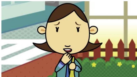
道に迷ったみたい。どうしよう…。