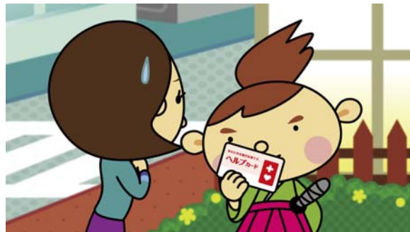
「ヘルプカード」の裏面には、障害のある人が手助けしてほしい内容が書いてあります。