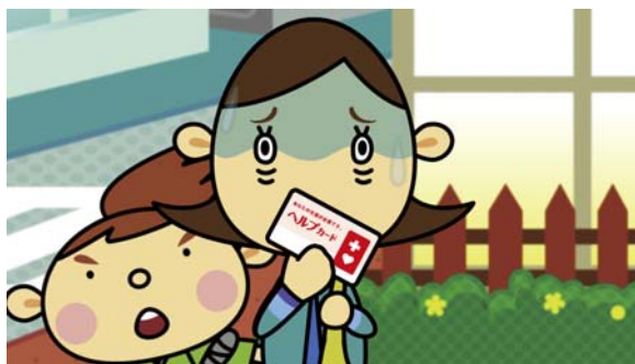
あっ! あのカードは「ヘルプカード」!