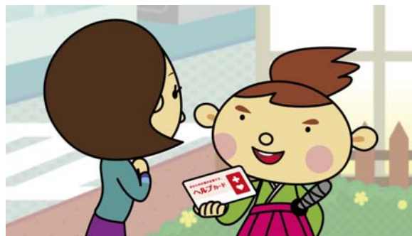
記載内容にそった支援をお願いします。