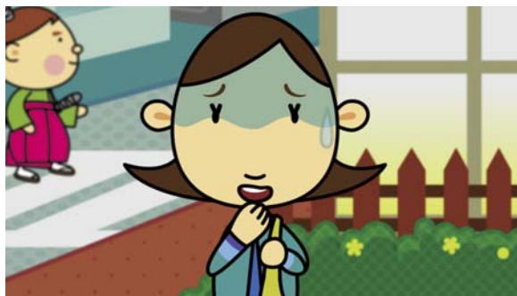
そこへ通りかかる「すけだちくん」。