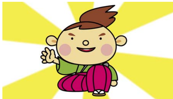
よし! 拙者がすけだちいたす!