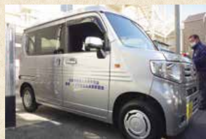
社会福祉施設への自動車寄贈

スポーツの試合やコンサート、演劇、展覧会など催事・イベントへの招待のとりまとめをお手伝いします。