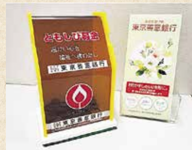
東京善意銀行のともしび募金箱