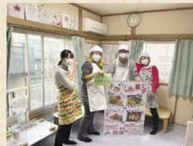
助成金でエアコンを購入した施設より、快適な環境になったと喜びの声をいただきました。