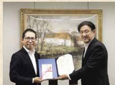
ご寄附への感謝状贈呈