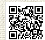
善銀ホームページ

社会福祉法人 東京都社会福祉協議会 東京善意銀行 〒101-0062 東京都千代田区神田駿河台1-8-11 東京YWCA会館3階 TEL: 03-5283-6890 FAX: 03-5283-6997 ホームページ: https://www.tcsww.tvac.or.jp/zengin/ メールアドレス: zen-i@tcsww.tvac.or.jp