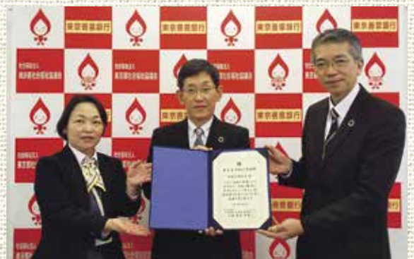
ご寄附への感謝状贈呈

顕著な功績のあった寄附者には、東京善意銀行より感謝状を贈呈しています。令和4年度は、96の個人ならびに団体に贈呈しました。